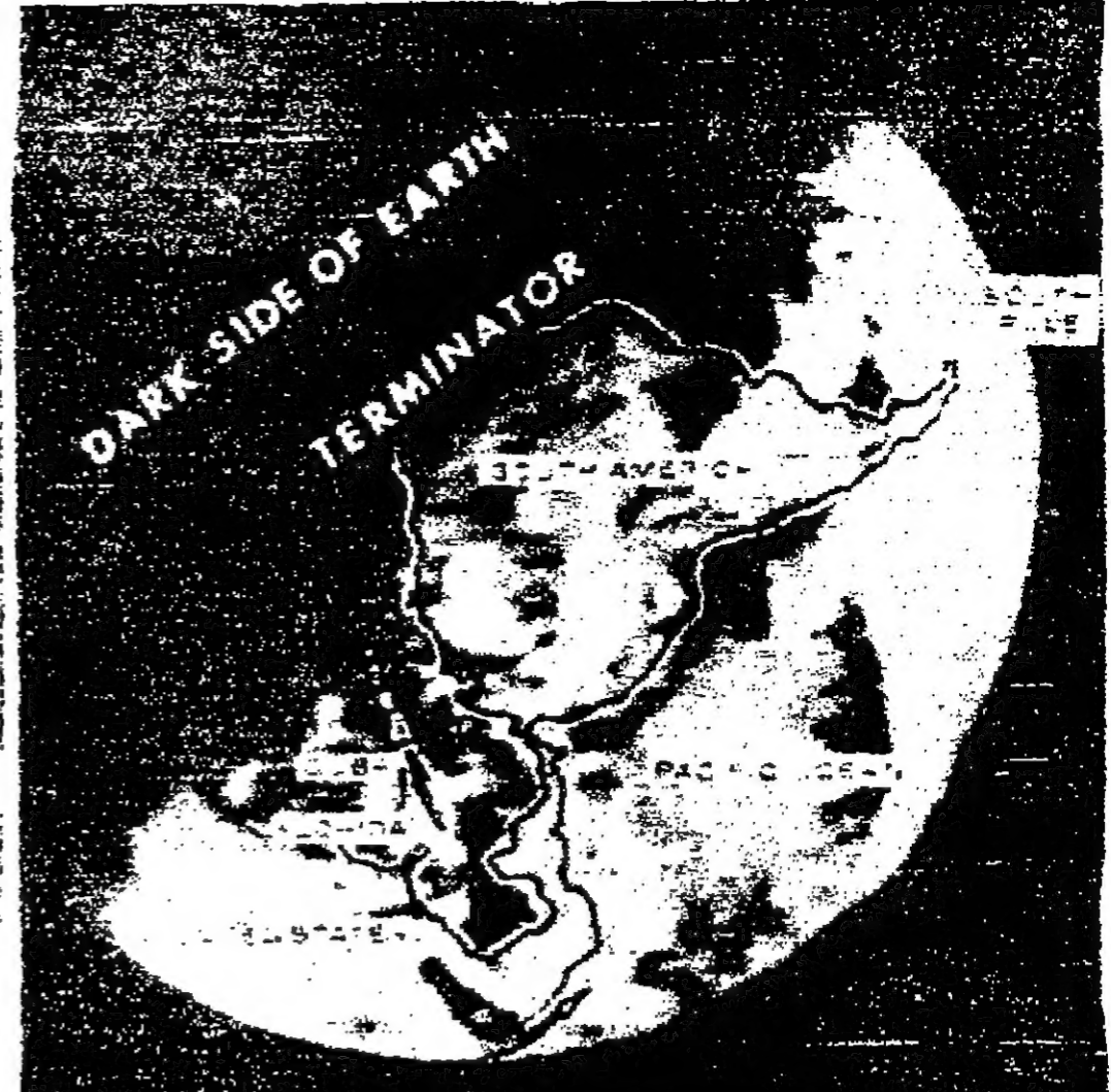
خط الوقت الفنتازيا «تيرميناتور» وهو خط وهمي يفصل بين الجانبين المضيئين والظلمة من الأرض...